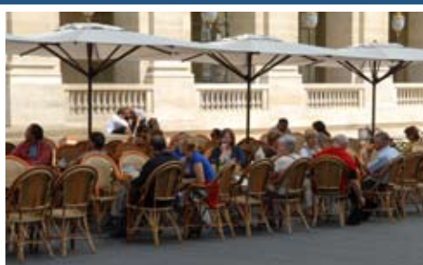
Au bord des quais